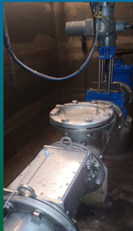
Régulation de débit

Procédé innovant par clapet gravitaire Mesure juste et fiable, validée sur banc hydraulique Fonctionnalités « métier » adaptées à l'assainissement Connexion Bluetooth Plug & Play